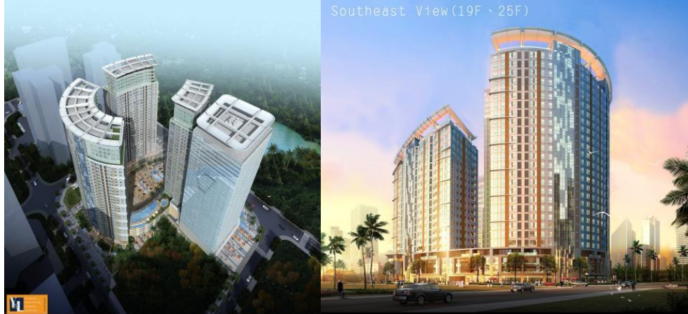
Southeast view (19F - 25F)